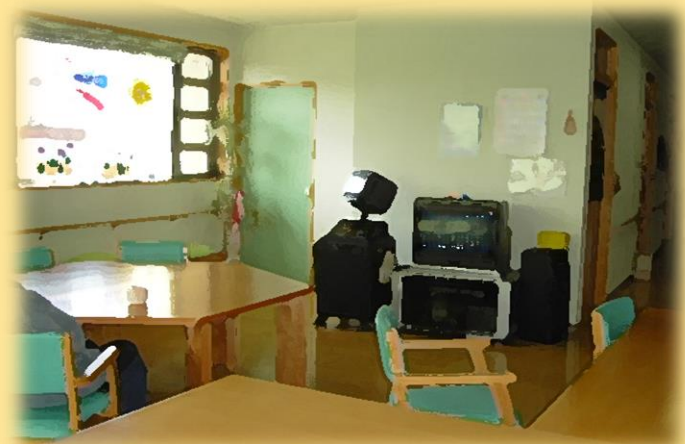
食堂 兼 ラウンジ